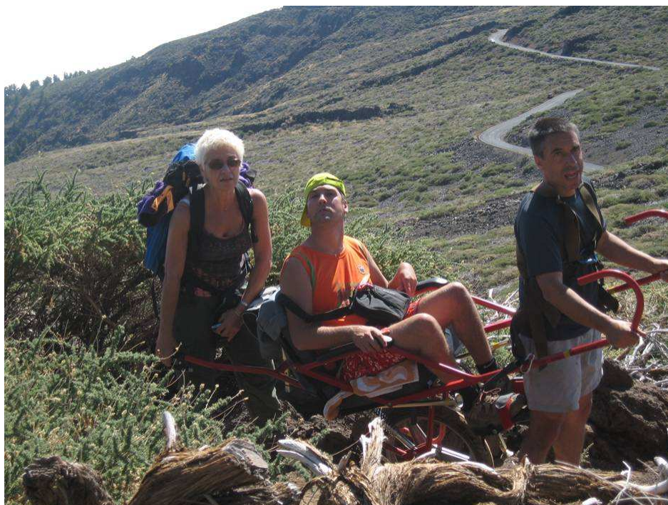
La Asociación francesa UMA (UNIVERS MONTAGNE Esprit Nature) recorrió La Palma en Joelette.