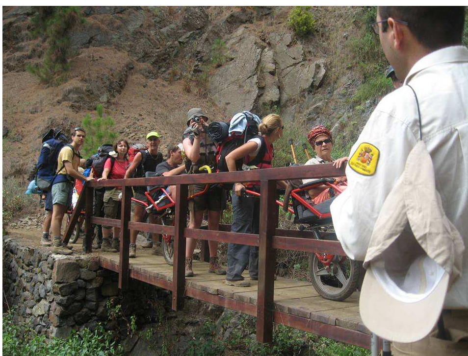
Entrada al Parque Nacional de Taburiente