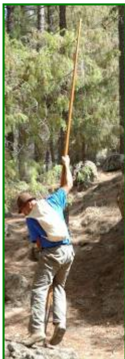
Diversos momentos de la exhibición del salto del pastor efectuados por miembros de la agrupación de La Aldea.