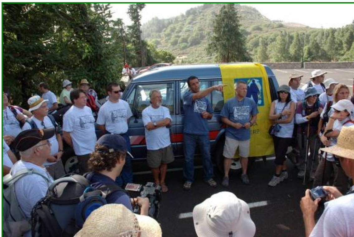
Primeras explicaciones sobre el desarrollo de la actividad.