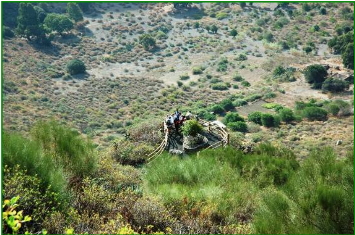
vista del mirador situado a mitad del descenso.