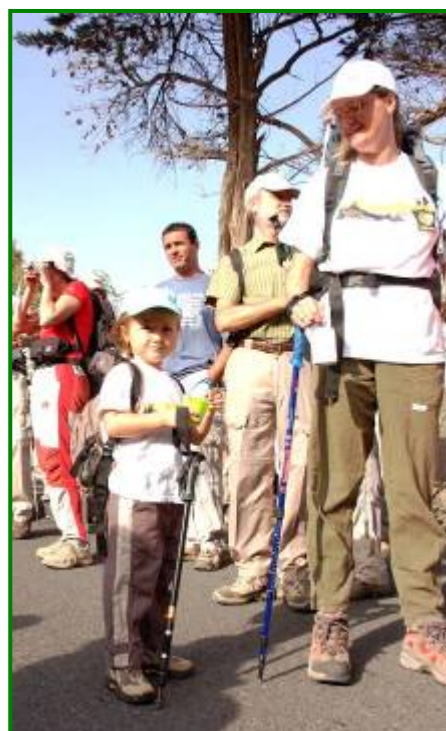
La benjamina, de apenas 4 años.