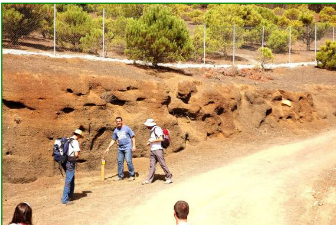
Momento de explicaciones ante una de las señales.