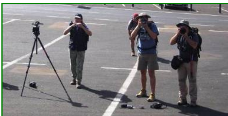
Se tomaron diversas fotos ya que todos los participantes querían tener la instantánea en sus cámaras.