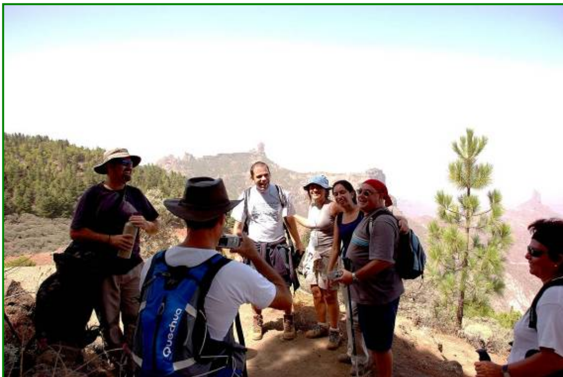
Buen lugar para tomar un recuerdo con el Nublo de telón de