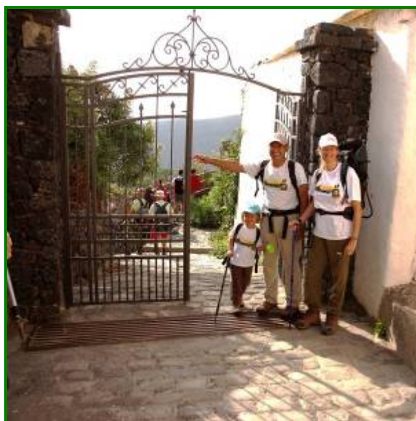
Foto de familia a la entrada a la caldera de Bandama.