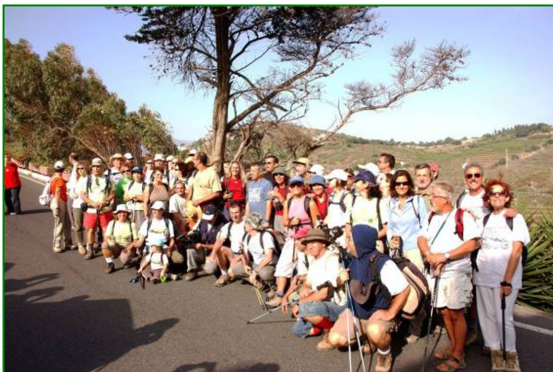
El grupo antes de la salida del domingo.