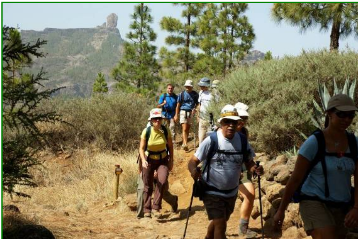
cabeza del grupo a su paso por la Degollada de la Cumbre.