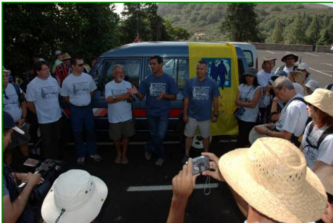
Acto de presentación del recorrido a los participantes.