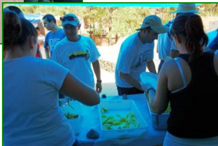
Dos instantáneas en el momento de servir la comida.