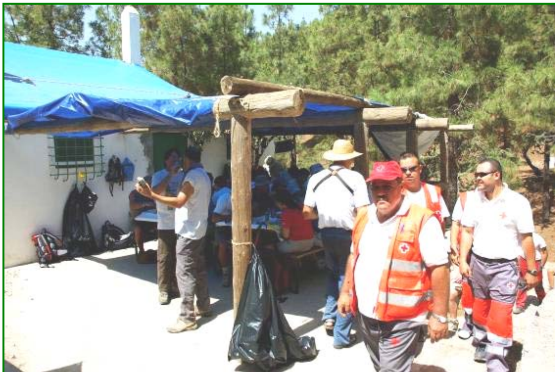
El equipo de Cruz Roja a su llegada al almuerzo.