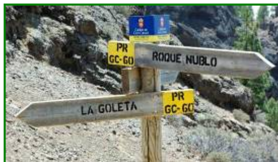
Señal ubicada en la Degollada de Nublo.