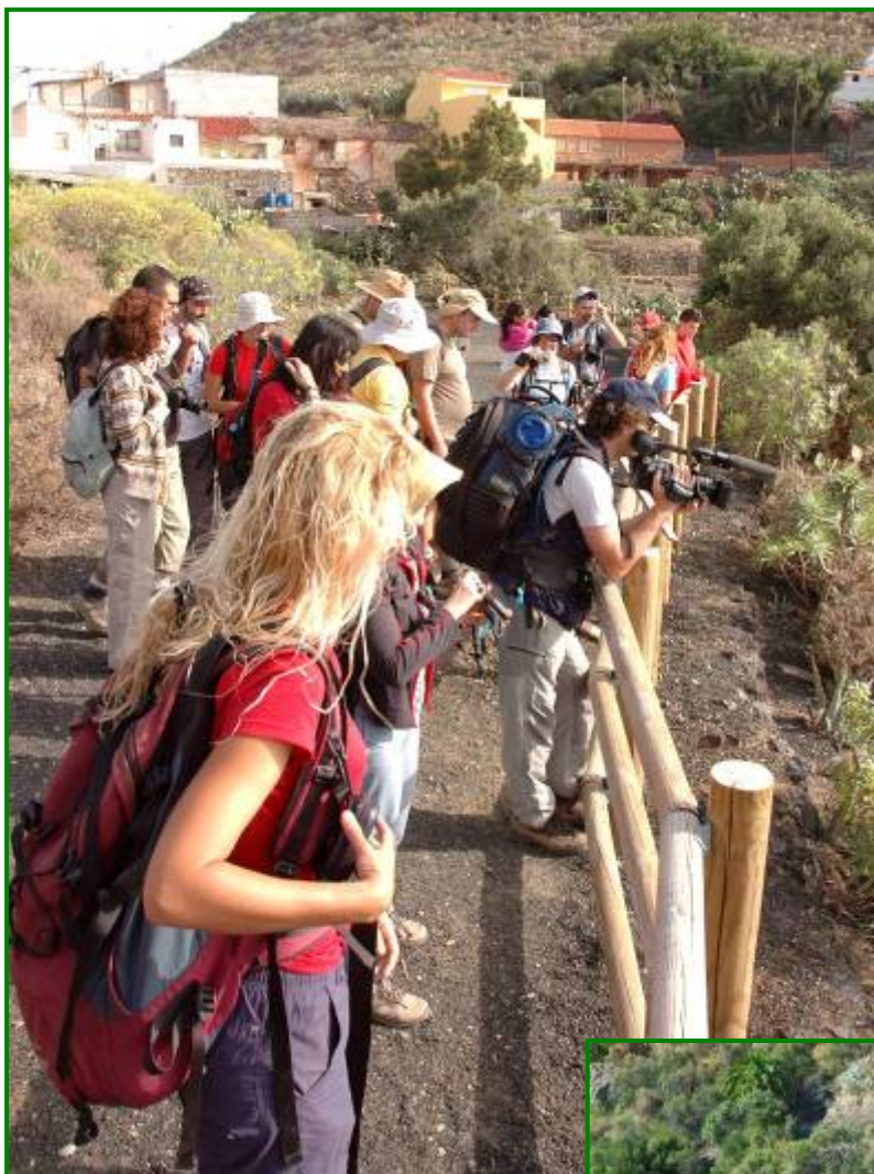
Los participantes hicieron un alto en el mirador situado a la entrada de la caldera.