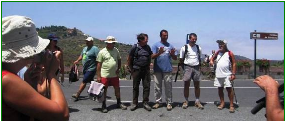
Acto de despedida que sirvió de clausura al evento..