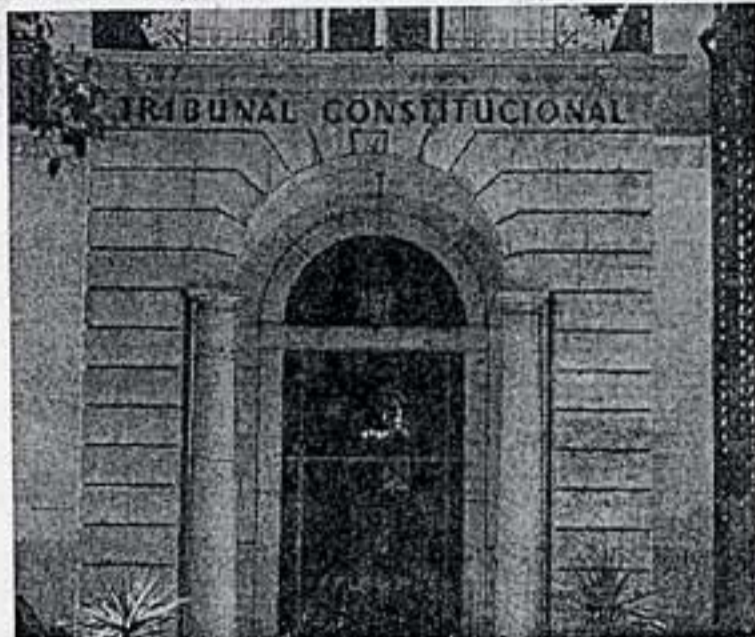
De acordo com Cavaco Silva, a promulgação da lei surge na sequência do parecer emitido pelo Tribunal Constitucional.

No entanto, advertiu que a lei foi aprovada pela maioria PS na Assembleia da República (com a abstenção do CDS-PP), passou pelo cri-