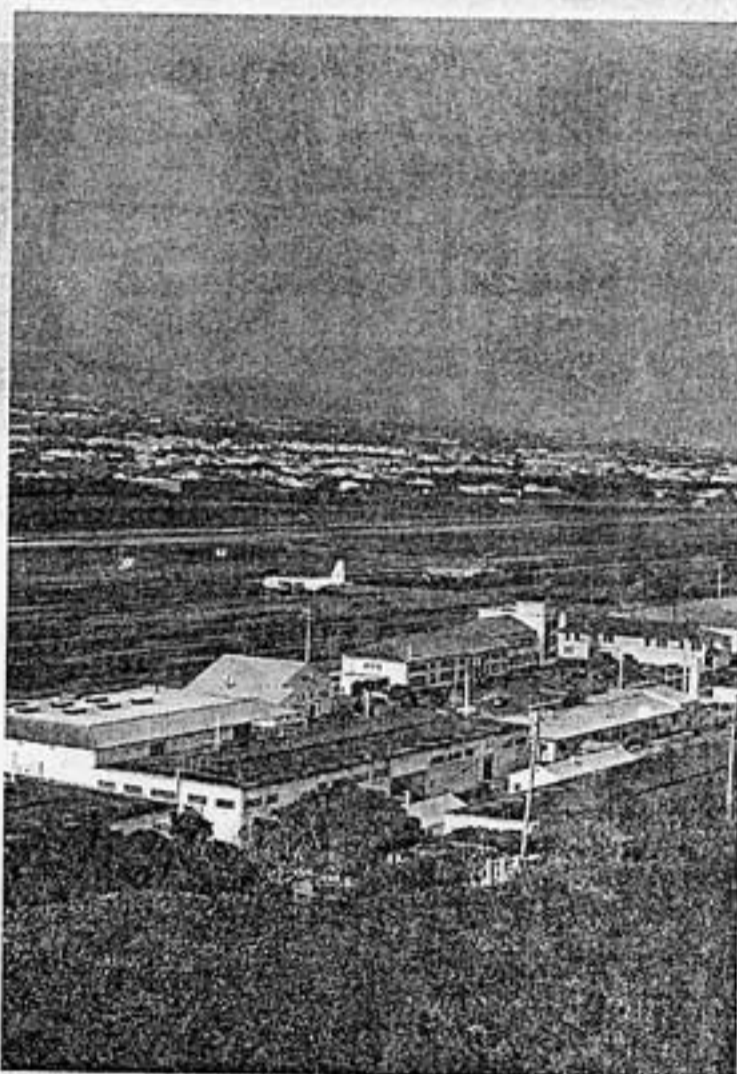
Overdose obriga a escala nas Lajes, Terceira

Tratava-se de um voo da companhia inglesa Thomson, vindo de Cancun, no México, com destino a Birmingham, na Inglaterra.]]