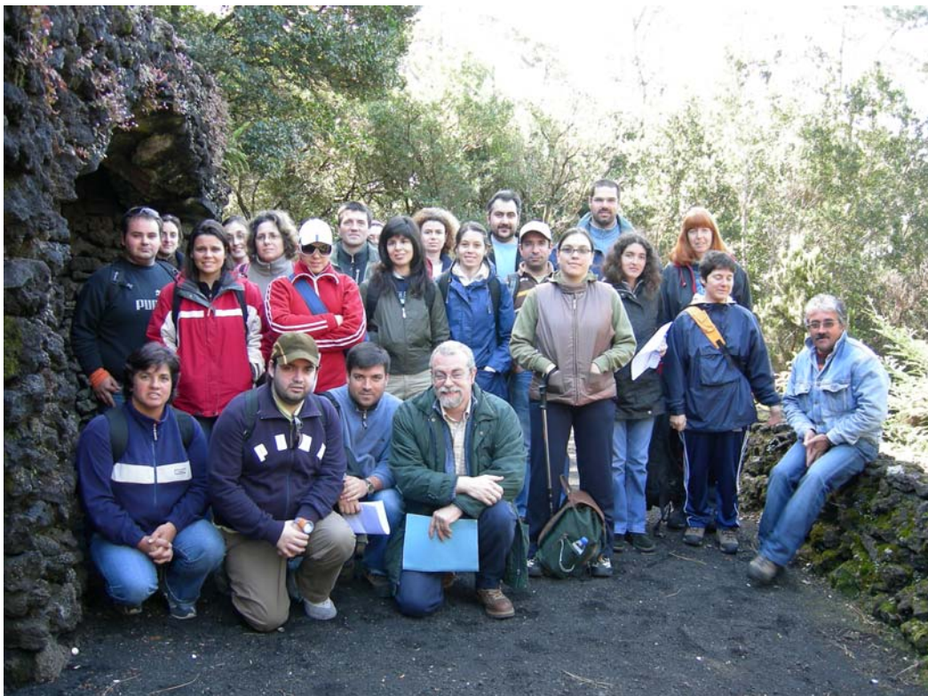
Formação Pedestrianismo. Saída de campo. Visita guiada a um percurso pedestre sinalizado. Conhecimento in situ de componentes do património natural. Troca de informações diversas.

FAIAL, AÇORES, 19 AL 24 DE MARZO DE 2007